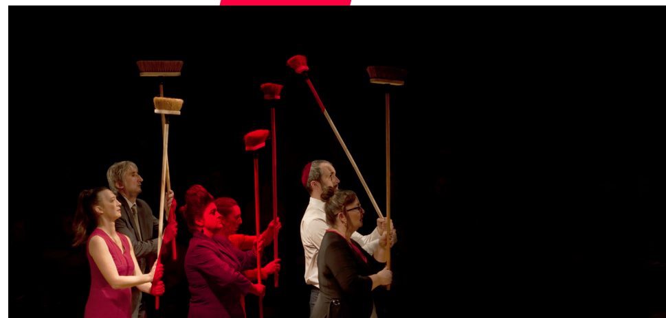
L'Effet fin de siècle.